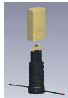
Oddělitelná skříň a základna