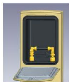
Vyměnitelné válce a armatury